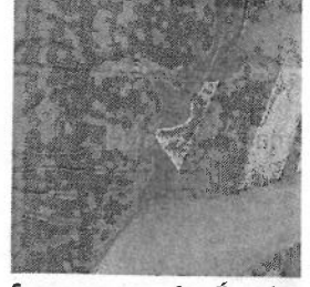
Saumur, rue des Écuries

Ce dispositif, véritable levier de développement des territoires ruraux, concerne 17 des 49 communes de Saumur Val de Loire : Blou, Courléon, Denezé-sous-Doué, Doué-en-Anjou, Gennes-Val de Loire, La Lande-Chasles, Longué-Jumelles, Louresse-Rochemenier, Mouliherne, Les Rosiers-sur-Loire, Saint-Clément-des-Levées, Saint-Martin-de-la-Place, Saint-Philbert-du-Peuple, Tuffalun, Les Ulmes, Vernantes et Vernoil-le-Fourrier.