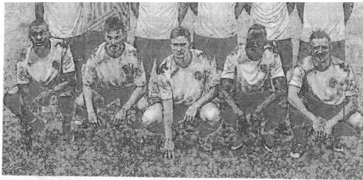
Avant d'affronter Angers à Beaufort, les Orléanais passeront par Saumur.

Le Saumurois penche plutôt du côté du SCO. Mais les footballeurs orléanais (Ligue 2) ont sûrement aussi des fans. Ça tombe bien, avant de disputer mercredi, un match amical contre les Angevins à 19 heures à Beaufort-en-Vallée,